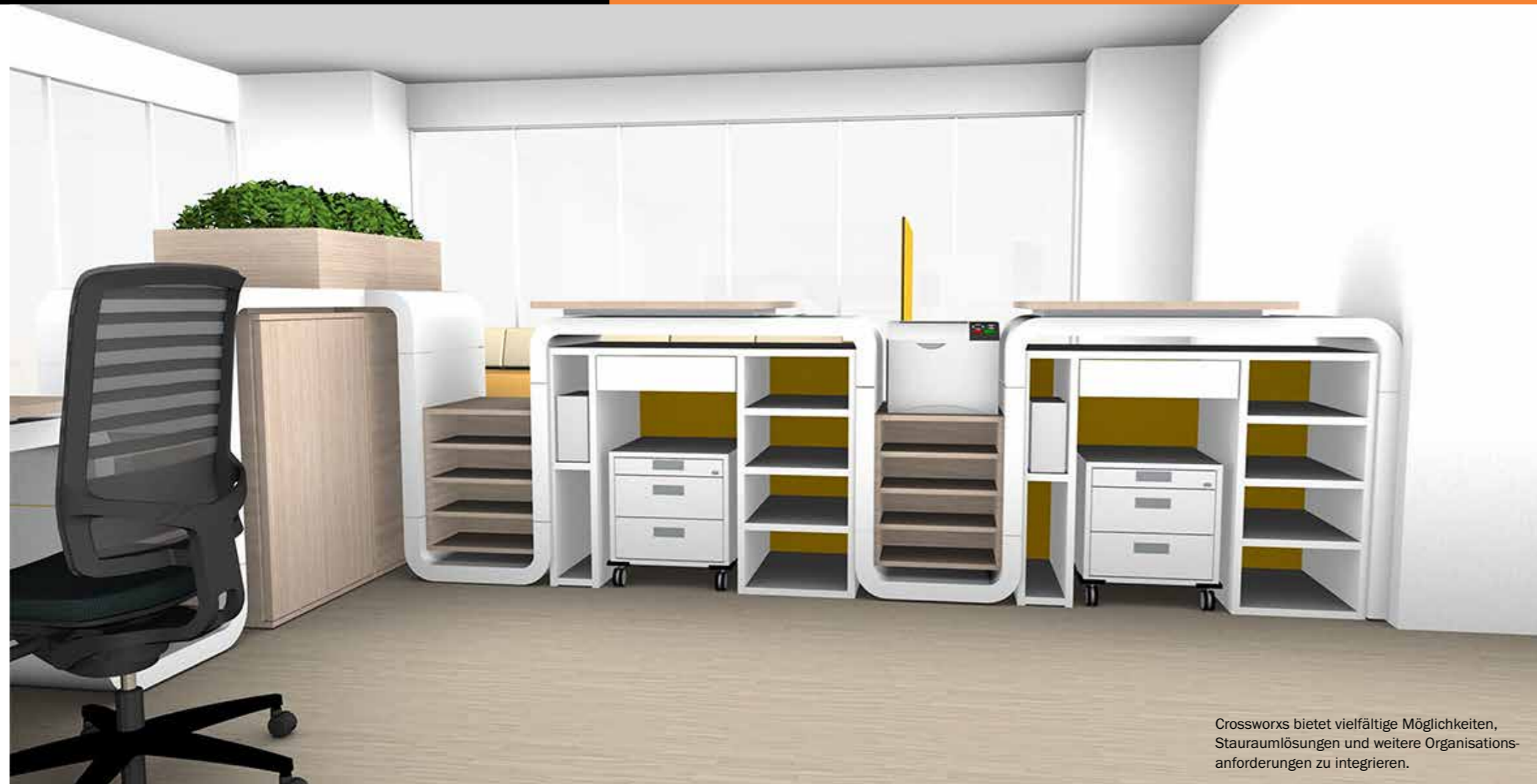
Crossworxs bietet vielfältige Möglichkeiten, Stauraumlösungen und weitere Organisationsanforderungen zu integrieren.