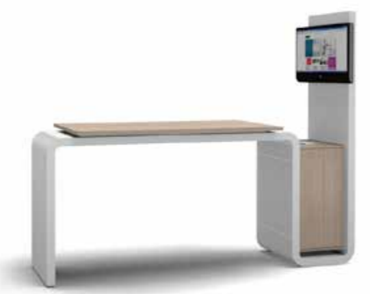
CrossMedia Stehelement B2000 x H1060 mm Technikschrank Präsentationswand H2000 mm