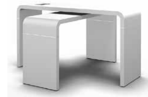
Crossworxs Bügelement B1600 x H960 mm B2000 x H1060 mm