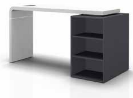
Crossworxs Bügelement B2000 x H1060 mm einseitig aufgelegt auf zwei Schrankelemente