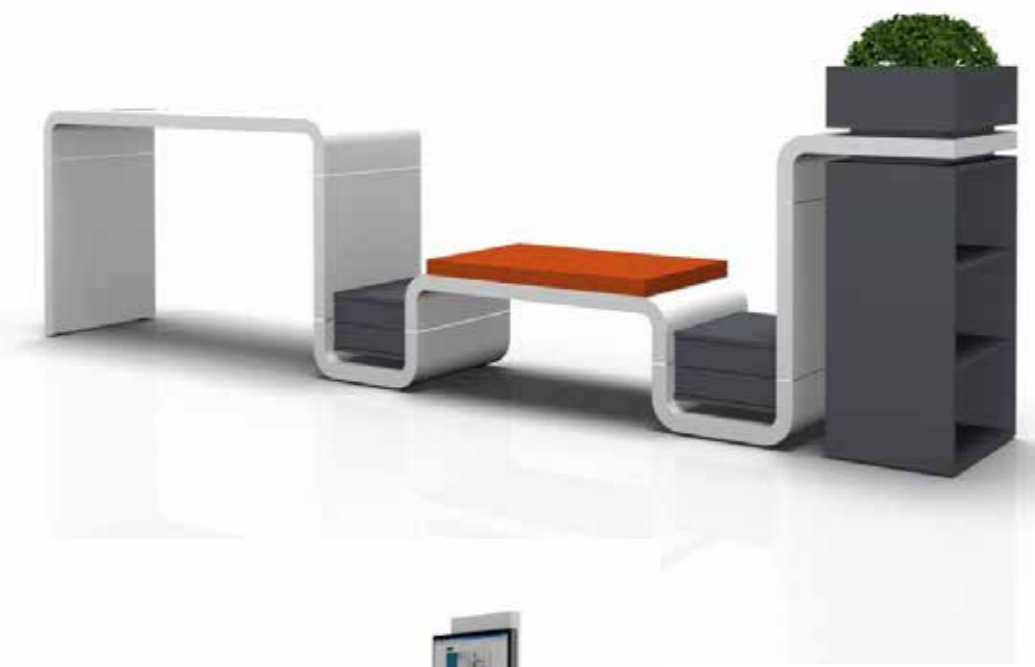
Crossworxs Stehelement B1600 x H1060 mm Sitzelement B1200 x H470 mm Bügel einseitig B620 x H1060 mm